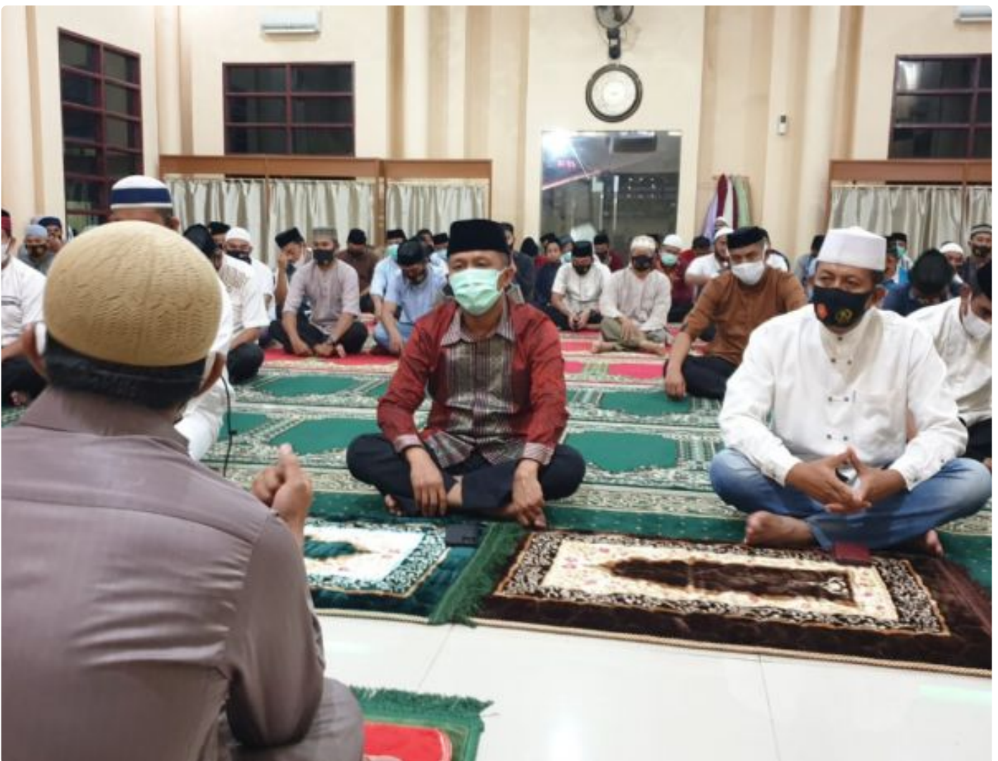
Polres Jeneponto menggelar dzikir dan doa bersama di Masjid As Syurty Mapolres Kabupaten Jeneponto.

JENEPONTO , - Bertempat di Masjid As Syurty Mapolres Kabupaten Jeneponto, Rabu (20/01/2020) sekira pukul 20.00 Wita. Polres Jeneponto menggelar dzikir