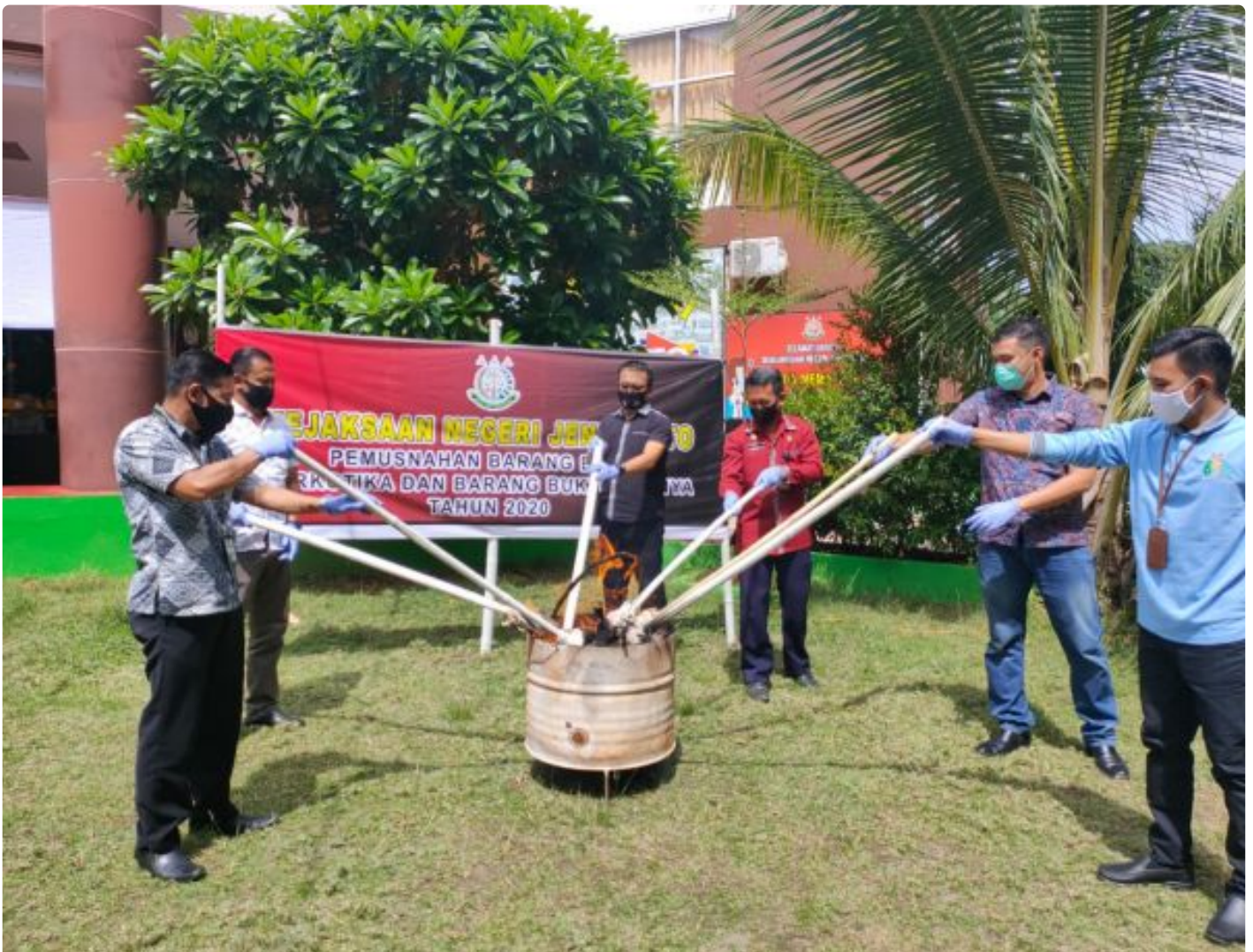
Kejaksaan Negeri Jeneponto Musnahkan Barang Bukti Narkotika Jenis Sabu Berat 12,7 Gram dan Barang Bukti Perkara Lainnya/Samsir.

JENEPONTO , - Kejaksaan Negeri ( Kejari ) Kabupaten Jeneponto kembali melakukan pemusnahan barang bukti perkara tindak pidana, di halaman Kejari Jeneponto, Jumat (11/12/2020).