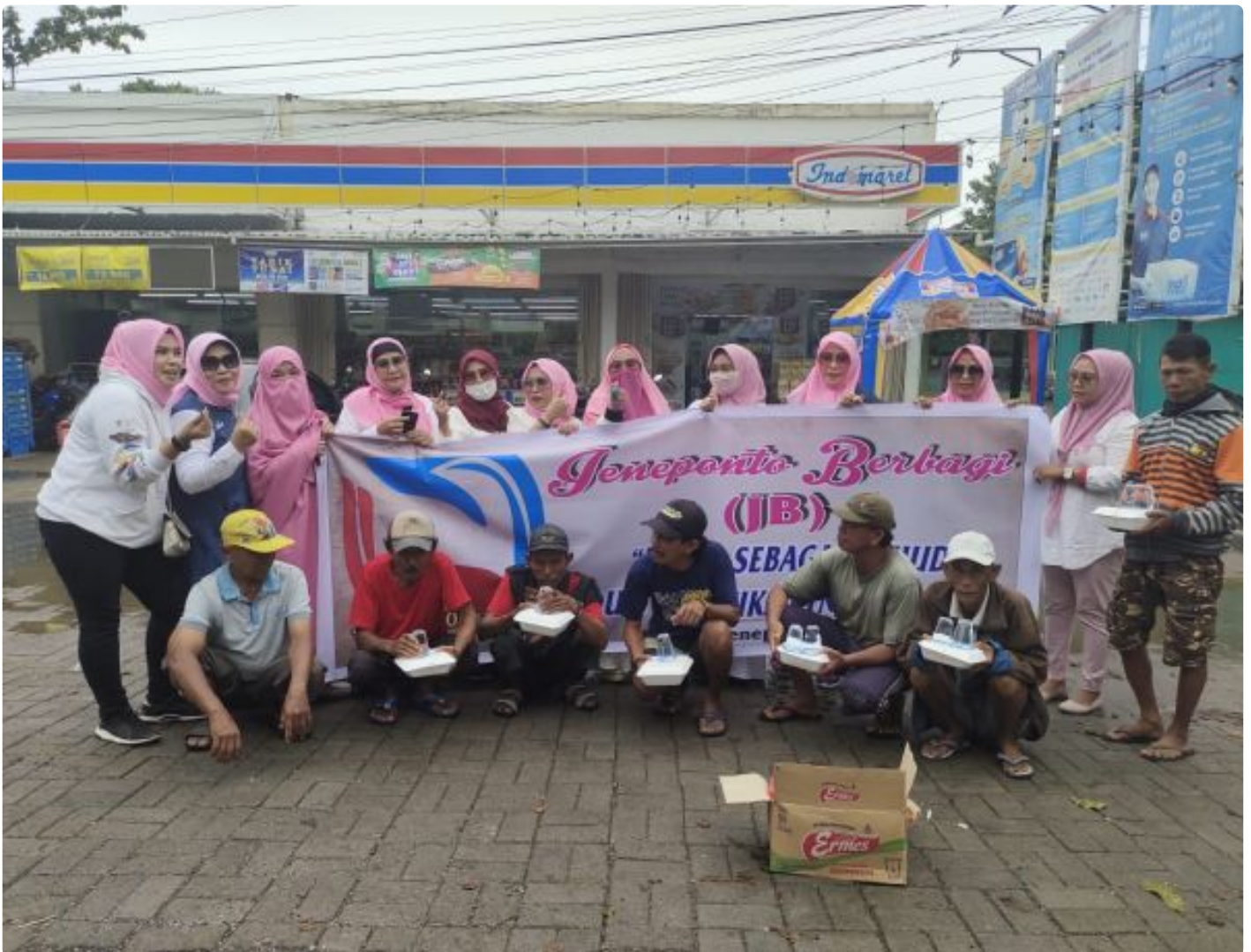
Komunitas Jeneponto berbagai menggelar bakti sosial (baksos) perdana terhadap warga kurang mampu/Syamsir.

JENEPONTO , - Jumat 2 Maret 2021, Komunitas Jeneponto berbagai menggelar bakti sosial ( baksos ) perdana. Sasarannya warga yang kurang mampu di Butta Turatea., seperti tukang becak dan tukang ojek.